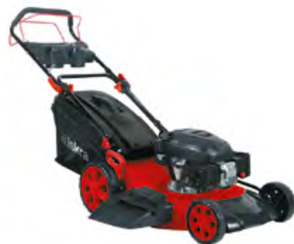
BENZINSKA KOSILICA HG56SMH-B