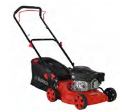
BENZINSKA KOSILICA HG41PL-RV125