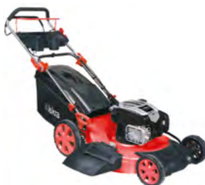
BENZINSKA KOSILICA HG56SMH-BS675EXi