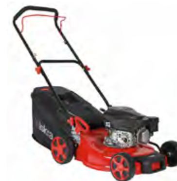
BENZINSKA KOSILICA BN46PL-RV145