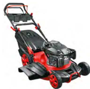
BENZINSKA KOSILICA HG53SMH-EA190