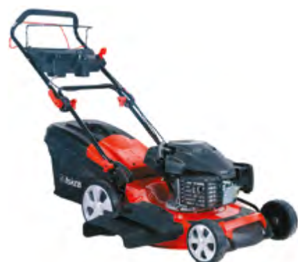
BENZINSKA KOSILICA HG53SMH-MA190