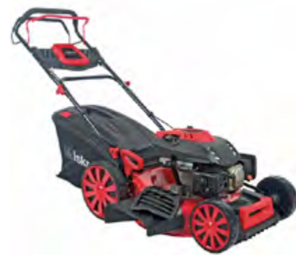
BENZINSKA KOSILICA HG51SMH-B